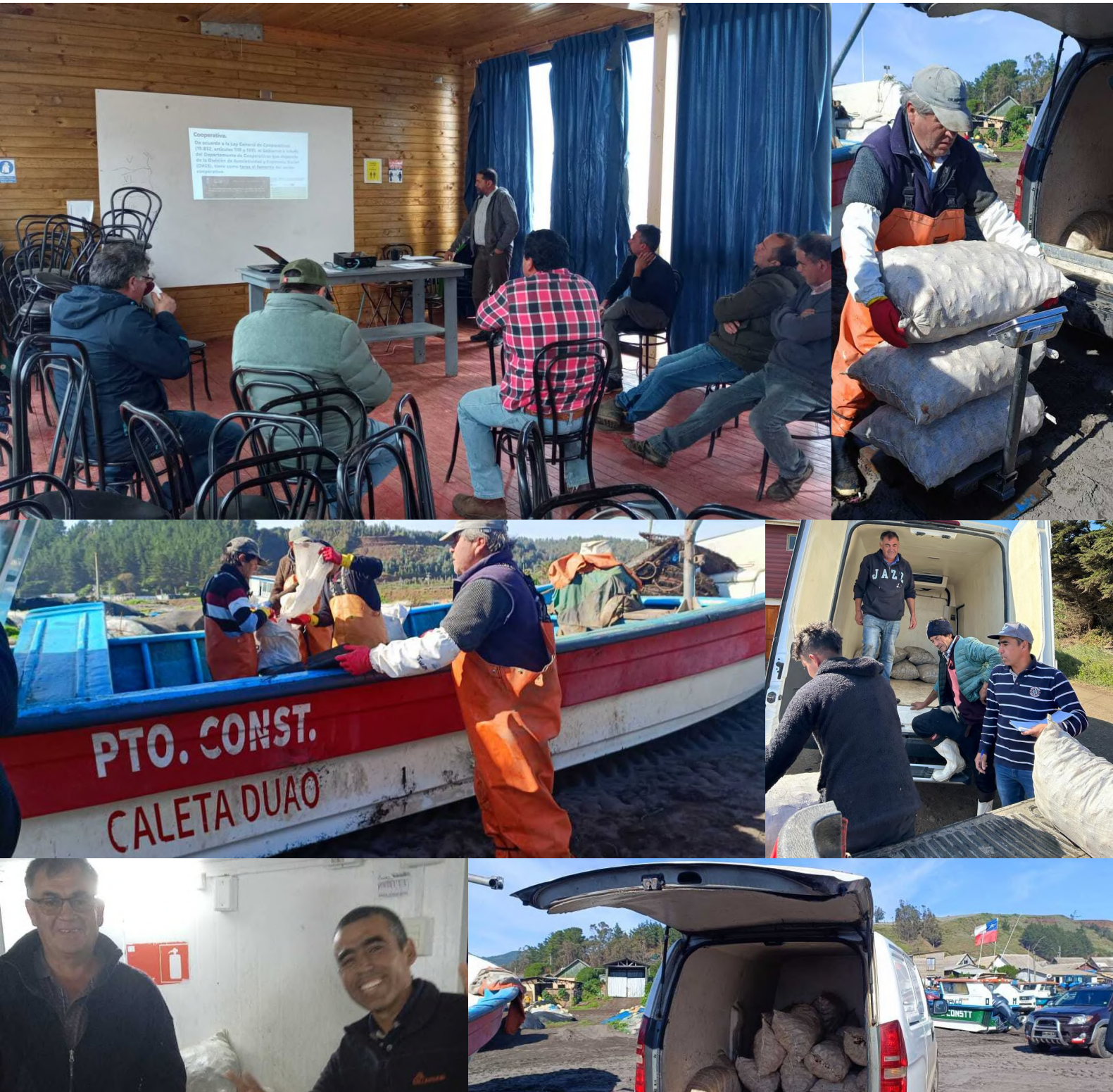
Reunión CoopDuaO y pilotos de comercialización: pesca, desembarque, transporte y venta por parte de miembros de CoopDuaO, durante 2023.