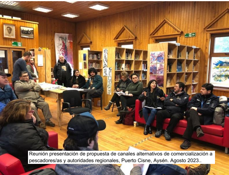
Reunión presentación de propuesta de canales alternativos de comercialización a pescadores/as y autoridades regionales, Puerto Cisne, Aysén. Agosto 2023..