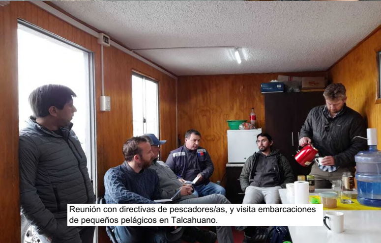
Reunión con directivas de pescadores/as, y visita embarcaciones de pequeños pelágicos en Talcahuano.