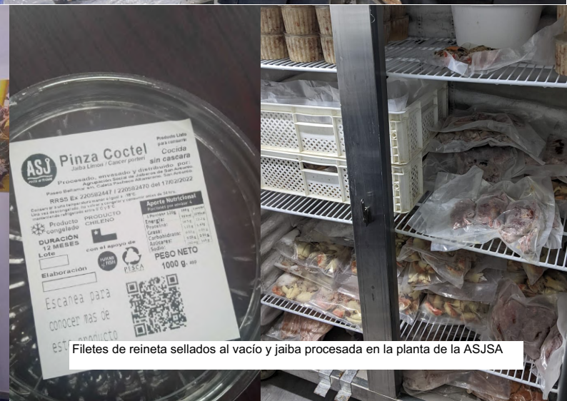
Filetes de reineta sellados al vacío y jaiba procesada en la planta de la ASJSA