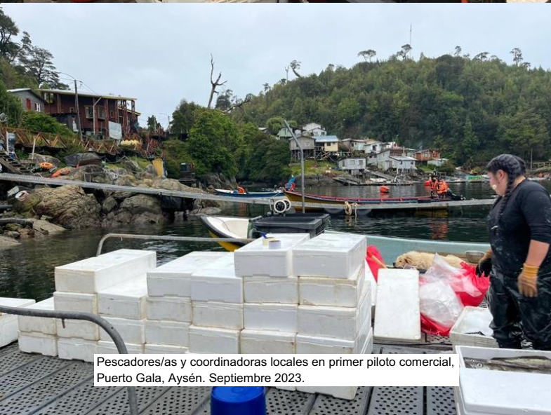
Pescadores/as y coordinadoras locales en primer piloto comercial, Puerto Gala, Aysén. Septiembre 2023.