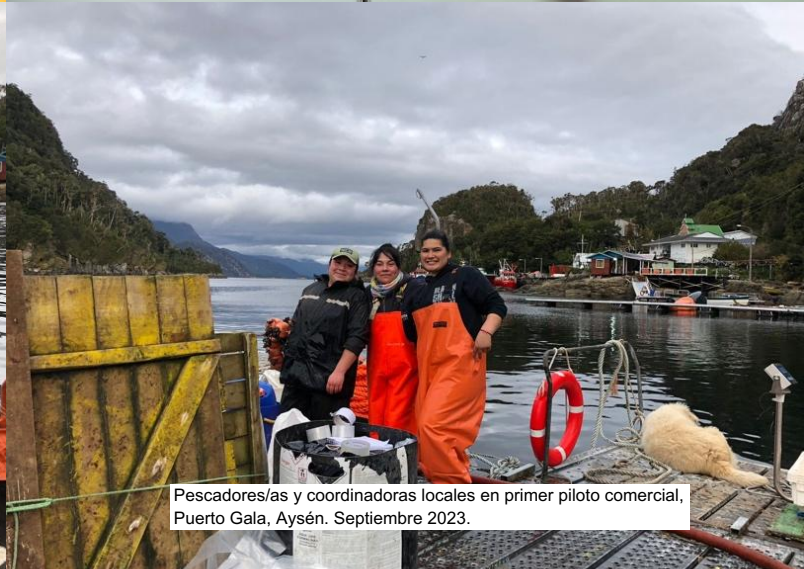
Pescadores/as y coordinadoras locales en primer piloto comercial, Puerto Gala, Aysén. Septiembre 2023.