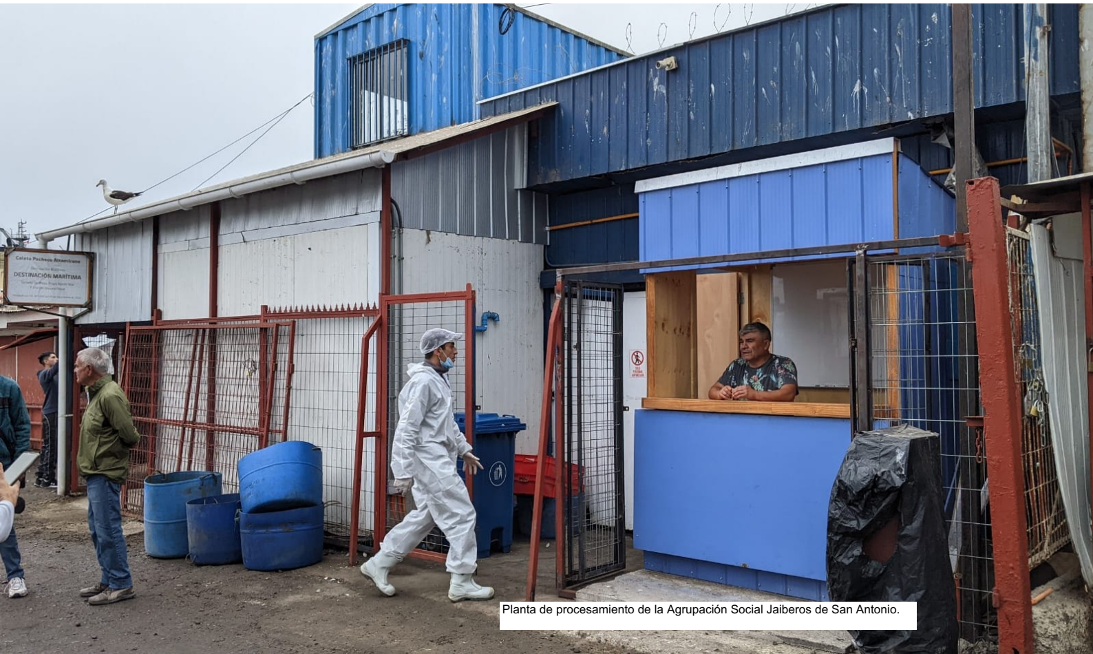
Planta de procesamiento de la Agrupación Social Jaiberos de San Antonio.