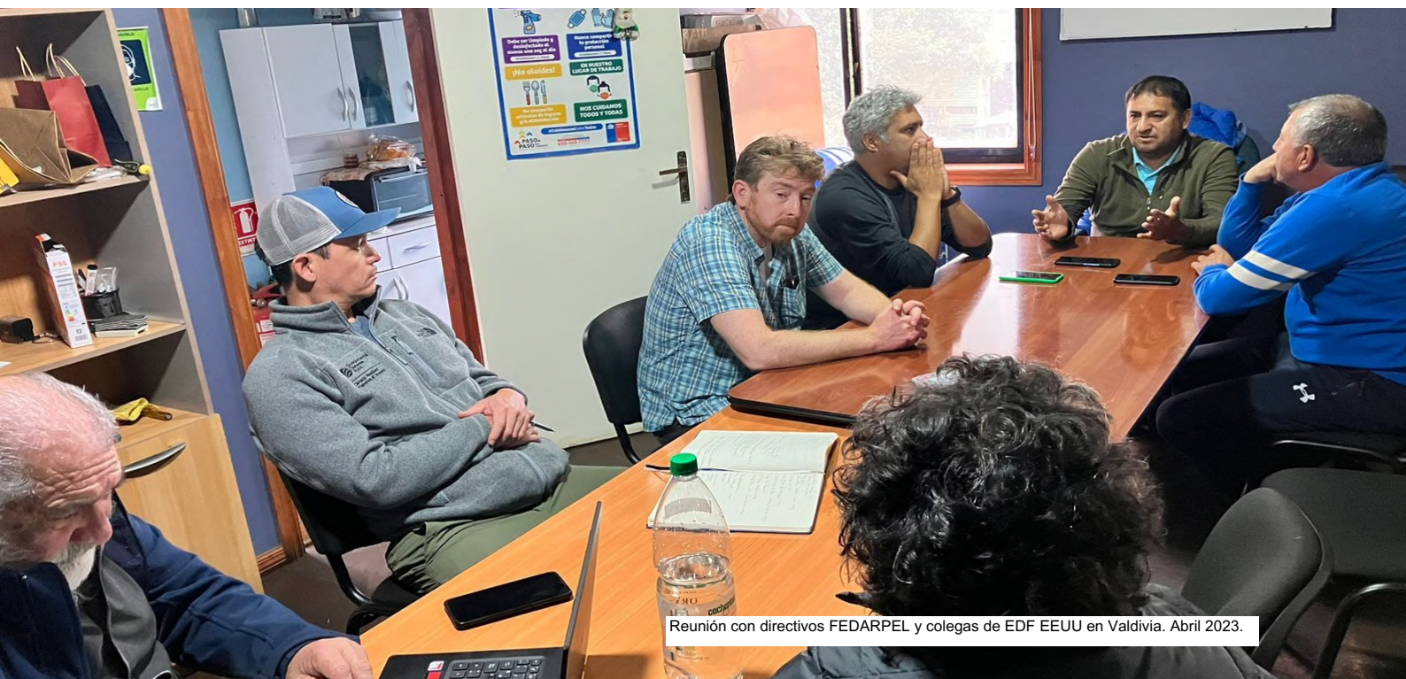
Reunión con directivos FEDARPEL y colegas de EDF EEUU en Valdivia. Abril 2023.