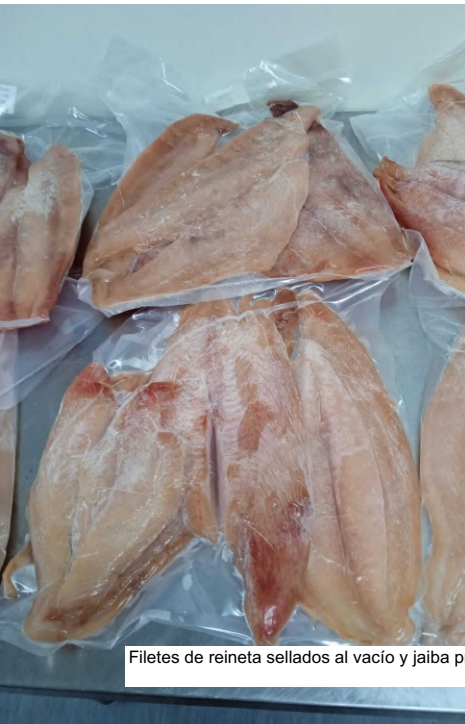
Filetes de reineta sellados al vacío y jaiba procesada en la planta de la ASJSA

Durante el mes de octubre acompañamos a los Jaiberos de San Antonio junto a nuestros colegas del Centro Pesca Sustentable, la Feria Food & Services, Santiago donde realizaron muestras de sus productos a potenciales clientes del sector HORECA.