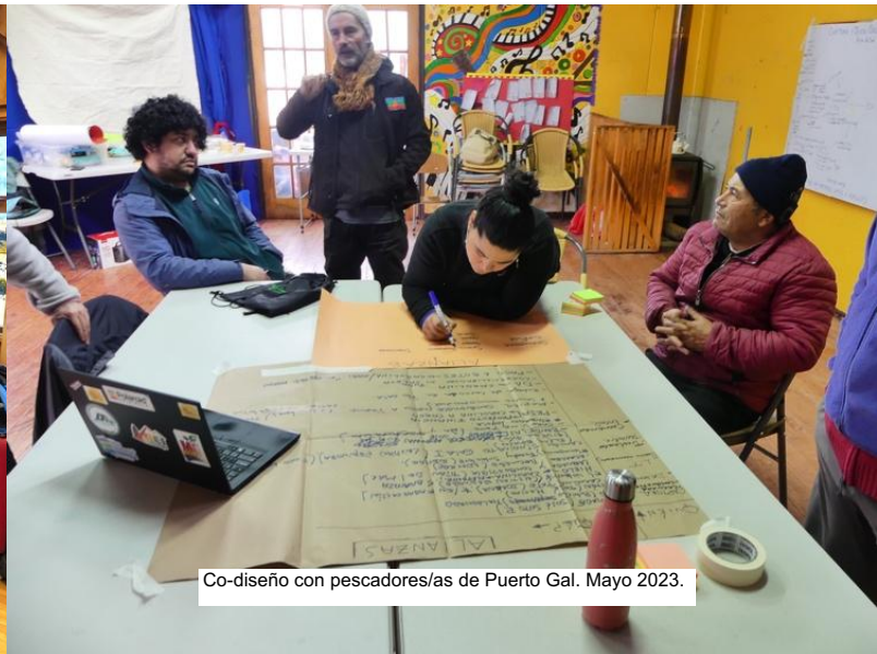
Co-diseño con pescadores/as de Puerto Gal. Mayo 2023.