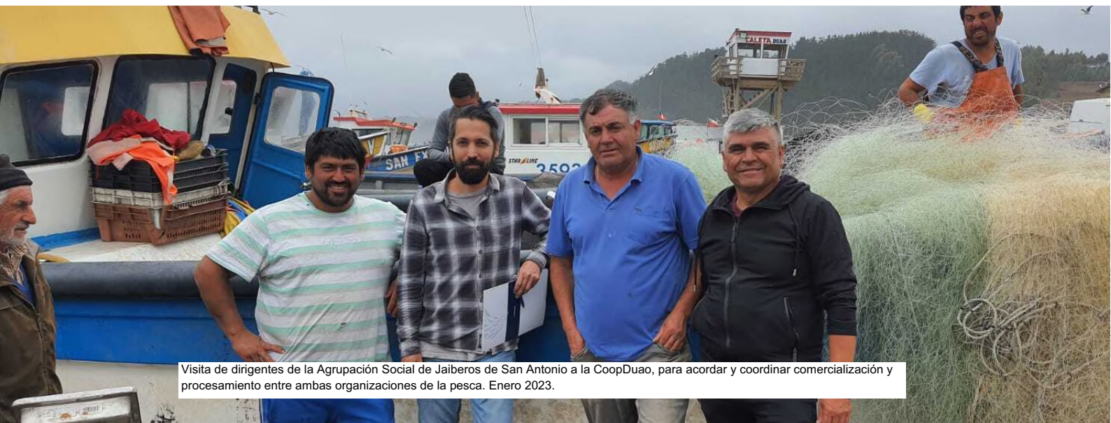
Visita de dirigentes de la Agrupación Social de Jaiberos de San Antonio a la CoopDuaou, para acordar y coordinar comercialización y procesamiento entre ambas organizaciones de la pesca. Enero 2023.