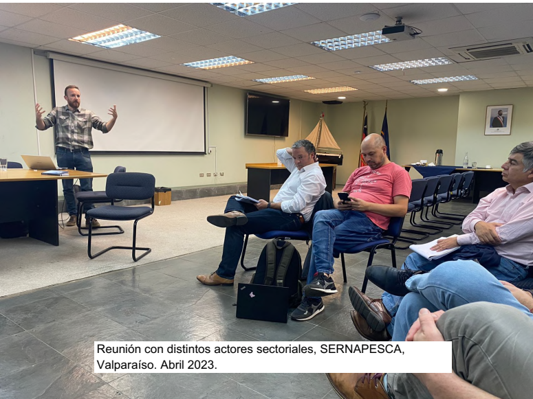
Reunión con distintos actores sectoriales, SERNAPESCA, Valparaíso. Abril 2023.