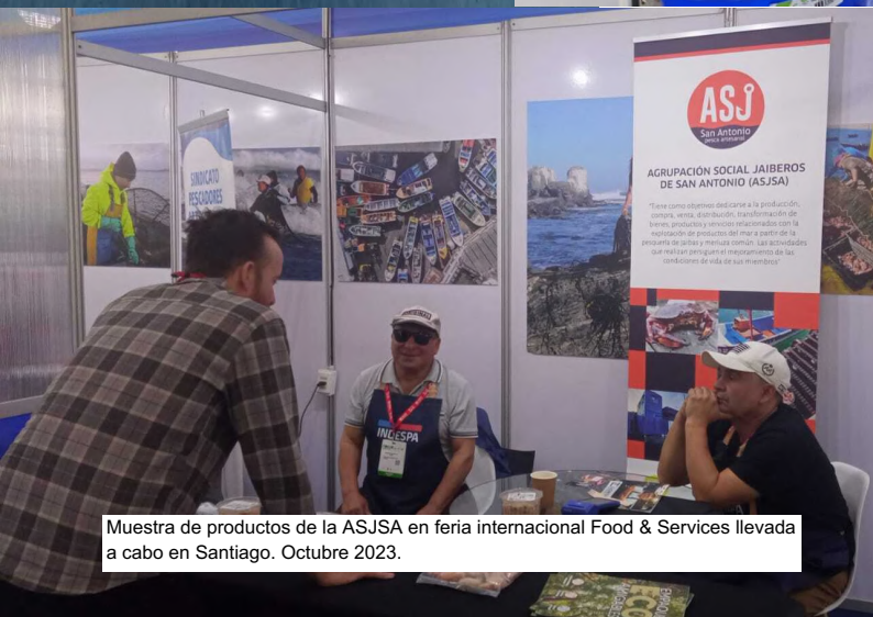
Muestra de productos de la ASJSA en feria internacional Food & Services llevada a cabo en Santiago. Octubre 2023.