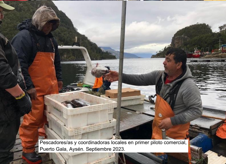
Pescadores/as y coordinadoras locales en primer piloto comercial, Puerto Gala, Aysén. Septiembre 2023.