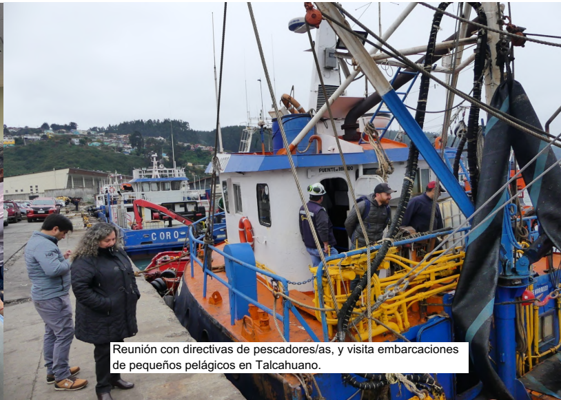
Reunión con directivas de pescadores/as, y visita embarcaciones de pequeños pelágicos en Talcahuano.