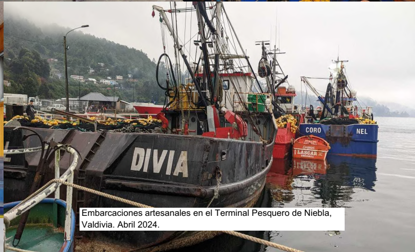
Embarcaciones artesanales en el Terminal Pesquero de Niebla, Valdivia. Abril 2024.