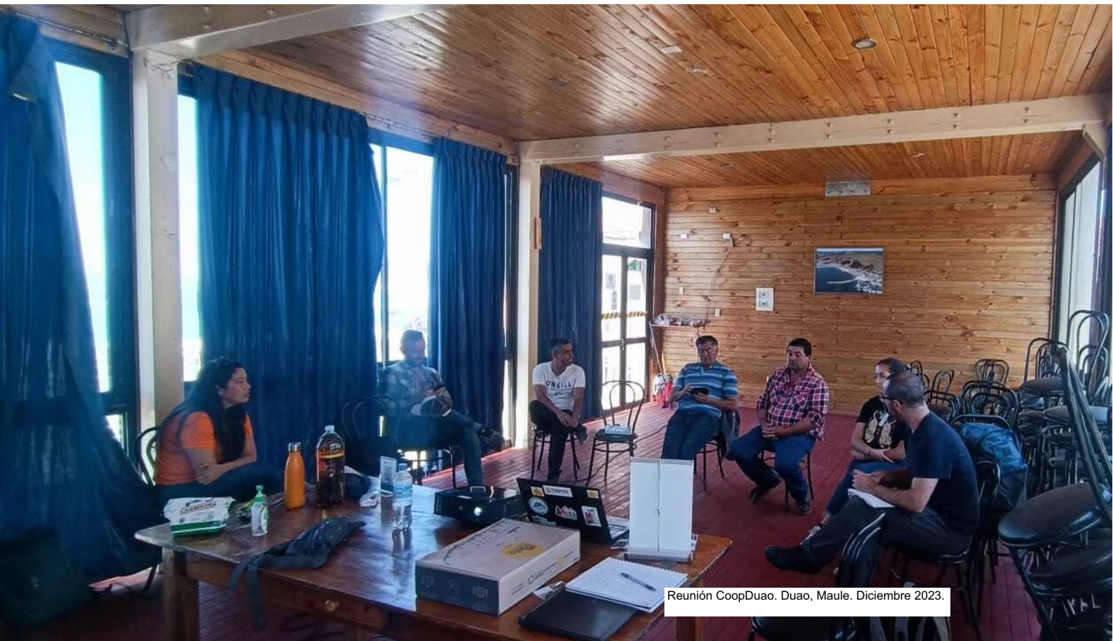
Reunión CoopDuao. Duao, Maule. Diciembre 2023.